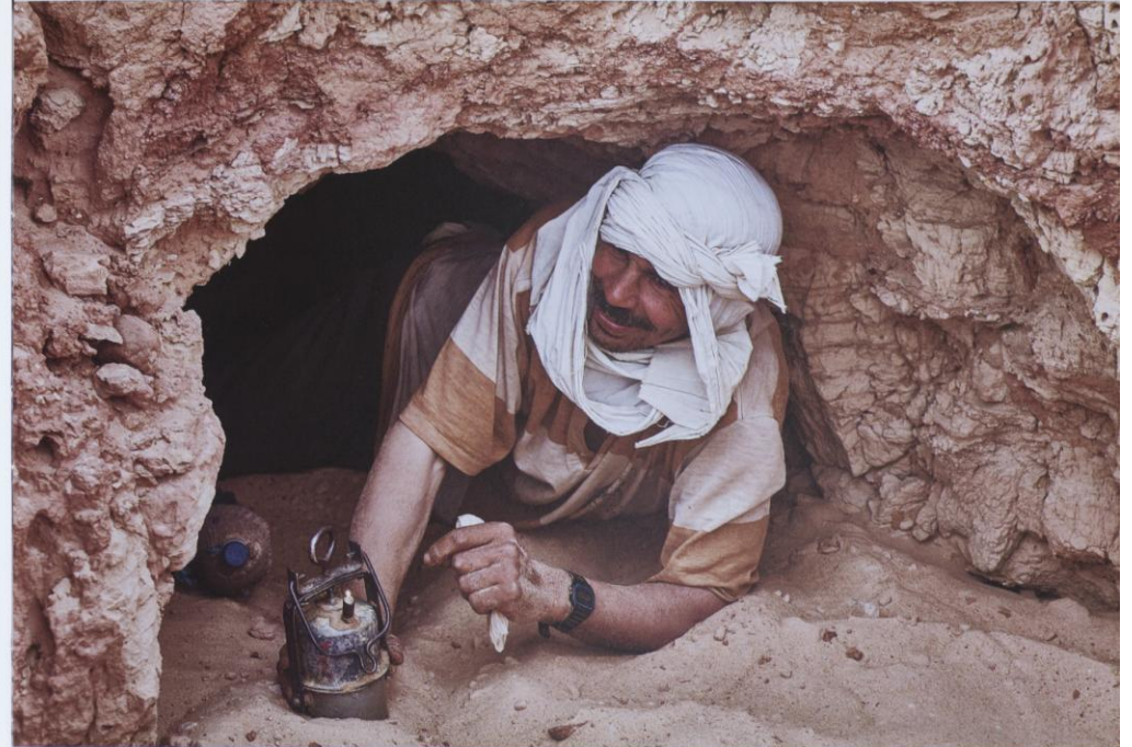
Luz Soñada. Rafael Portal (Nizam Editorial 2016)

Fueron días donde los matices, la luz reflejada, los espejismos de difusa bruma cristalina, como agua de lluvia, clarificaron toda posibilidad.